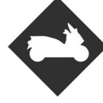
PERMIS MAXI SCOOTER