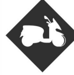
PERMIS 3 ROUES

Notre école de conduite dispose d'une piste située à Chambéry